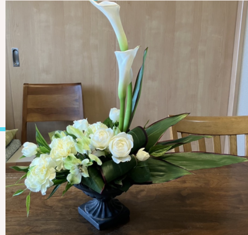
※作品例です。 当日の内容とは異なりますのでご了承ください。